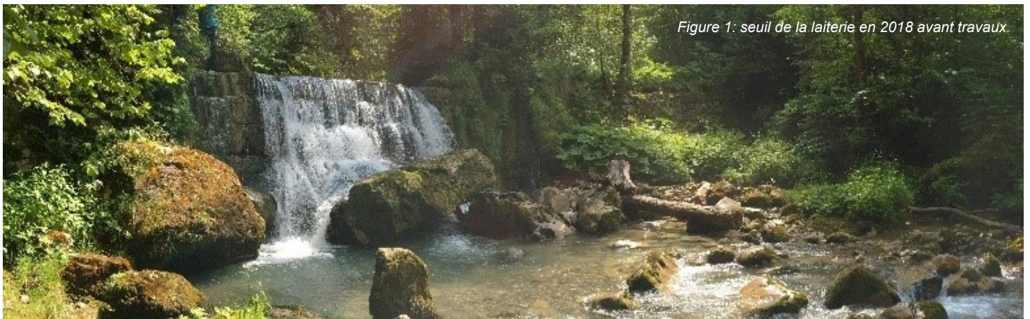
Figure 1: seuil de la laiterie en 2018 avant travaux.

Été 2020, il a été finalisé les arasements complets des deux seuils en conservant toutefois pour chacun d'entre eux, des piliers latéraux afin de ne pas déstabiliser les berges.